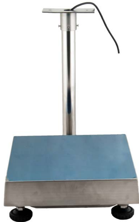
Typical model TNS3030-zzzkg / Modèle typique TNS3030-zzzkg