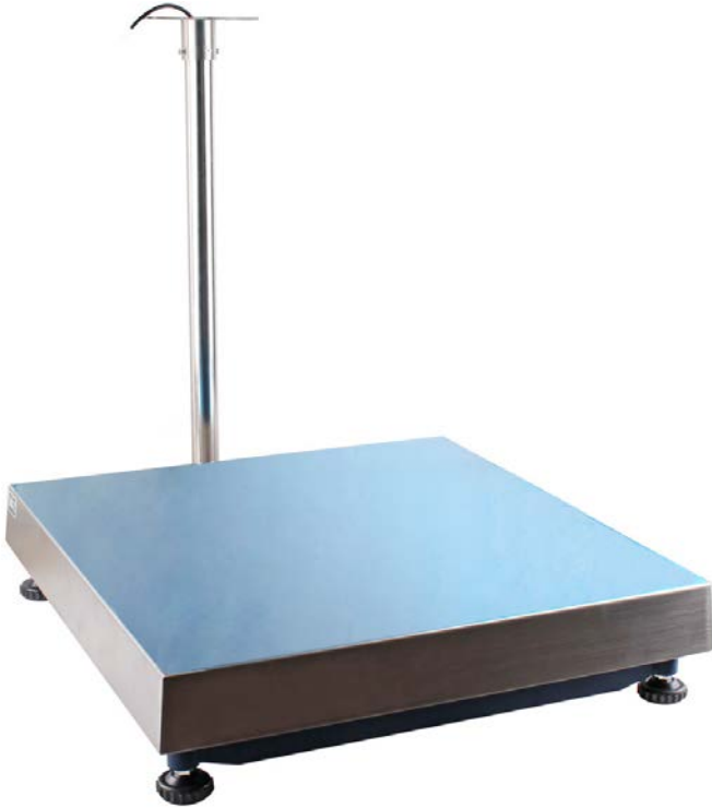
Typical model TN6060-zzzkg / Modèle typique TN6060-zzzkg